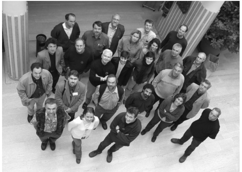
Die Teilnehmerinnen und Teilnehmer am UNIGIS Business Meeting 2002 in Salzburg