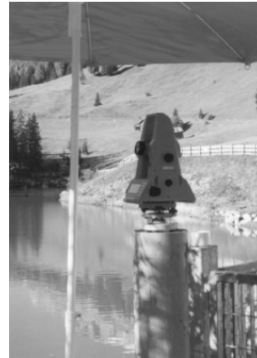
Geodätische Überwachungsvermessung am Wasserspeicher Planac' (Alta Badia - Juni 2002)

geeigneter GIS-Software (ArcView und CADdy+ + GeoMedia) und vor allem durch das im Uprof Lehrgang erworbene Wissen sind wir in der Lage, Vermessungsdaten mit Geodaten aus unterschiedlichen Quellen (Kataster, Landesgrundkarte usw.) zu integrieren und so aufzubereiten, dass eine Durchgängigkeit bei der Fortführung und Verwaltung dieser Daten