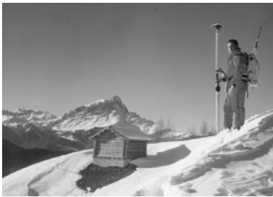
GIS - Datenerfassung mit GPS (Armentara Wiesen Januar 1998)

Zum Tätigkeitsfeld der Firma gehören sowohl die traditionellen Aufgaben im Vermessungsbereich wie Kataster und Ingenieurvermessung als auch Dienstleistungen im Bereich von GPS-Anwendungen und in der Architekturvermessung.