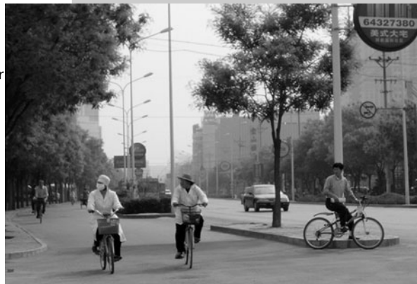
Fast menschenleer und SARS-geprägt: Peking. Lesen Sie im E-mail links, wie es einem UNIGIS-Teilnehmer im Krisengebiet ergangen ist.