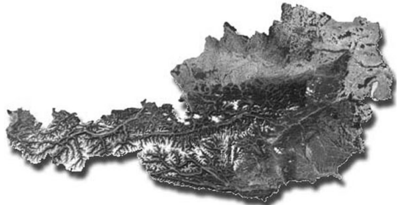
Landsat Satellitenbilder mit ER Mapper verarbeitet.

In diversen „Wizards“ (Georeferenzierung, Mosaikierung, Farbausgleich, etc.) sind oft benötigte Arbeitsschritte benutzerfreundlich zusammengefasst. Dadurch ist der Umgang mit ER Mapper leicht erlernbar und man erhält rasch professionelle Ergebnisse. Durch Batchverarbeitung werden wiederholte Berechnungsschritte automatisiert.